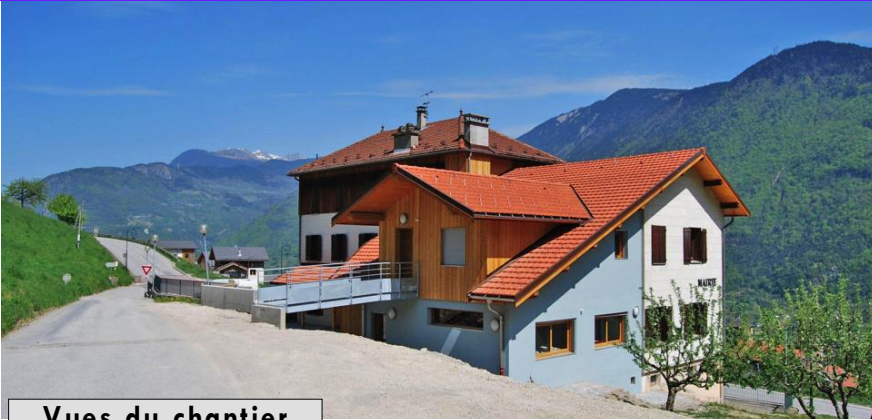
Vues du chantier